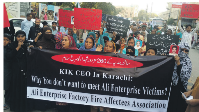
Betroffene des Fabrikbrandes bei KiK-Zulieferer in Pakistan demonstrieren für Gerechtigkeit.