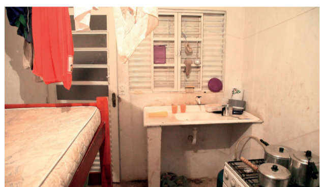
Erntehelfer in Brasilien wohnen häufig auf engstem Raum zusammengepfercht zu übersteuerten Mieten.