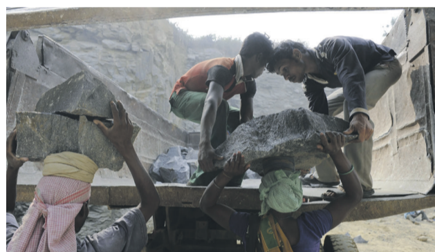
Ausbeuterische Kinderarbeit in einem indischen Steinwerk

werden weltweit durch Monokulturen, Bergbau, Stahlwerke und Fabrikanlagen verwüstet. Giftige Abwässer aus Minen und der industriellen Land-