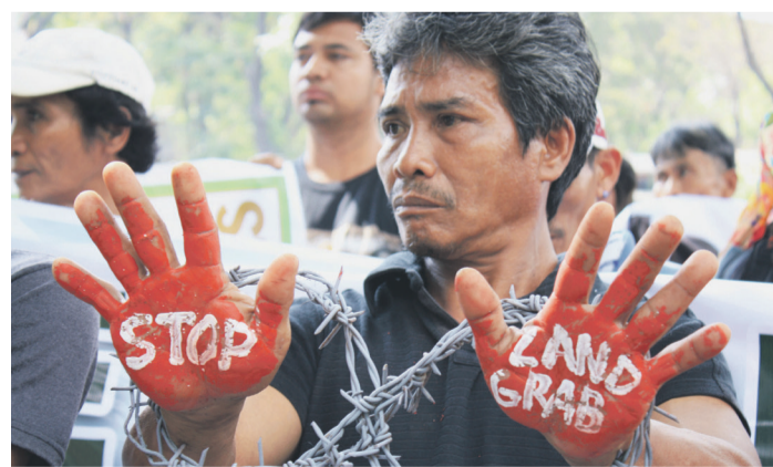
Protestaktion gegen Landgrabbing in den Philippinen