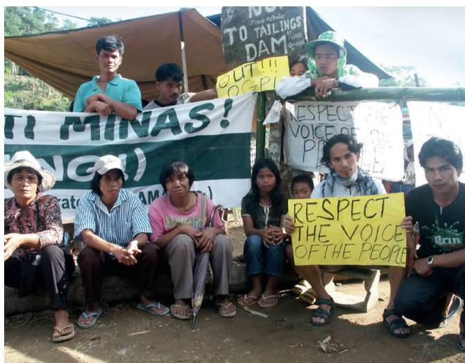
Indigene protestieren gegen die Didipio Goldmine des australischen Bergbaukonzerns Oceana Gold in den Philippinen.

Als Ecuador und Südafrika 2014 einen neuen Anlauf unternahmen, im UN-Menschenrechtsrat ein verbindliches Abkommen auszuhandeln, machte die Wirtschaft mobil. Doch aller Lobbyarbeit zum Trotz wurde die Einrichtung einer zwischenstaatlichen Arbeitsgruppe zur Erstellung des Abkommens beschlossen. Daraufhin machten die Wirtschaftsverbände eine taktische Kehrtwende. Sie kündigten an, sich an den Diskussionen in der Arbeitsgruppe zu beteiligen. Wenn sich Wirtschaft und Industrieländer heraushielten, so die Befürchtung, könnte sich