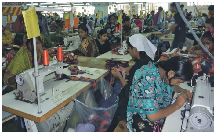
Textilnäher*innen in Bangladesch

» Wenn die Initiatoren, Ecuador und Südafrika, ihre Führungsrolle klug nutzen, ist ein guter Vertrag möglich – auch ohne Unterstützung aller Staaten des Globalen Nordens. Würde der Vertrag von, sagen wir, 75 Staaten des Globalen Südens ratifiziert, könnte das die Spielregeln ändern: Ein deutsches Unternehmen, das in Bangladesch agiert, könnte dem Vertrag unterlie-