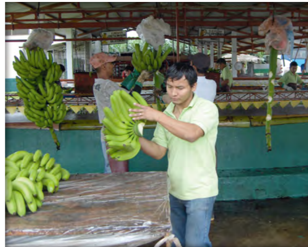
Arbeiter auf Bananenplantage

Viele dieser Rechte sind auch durch entsprechende nationale Gesetze der Produktionsländer geschützt. Deren Verletzung wird jedoch zumeist nicht geahndet.