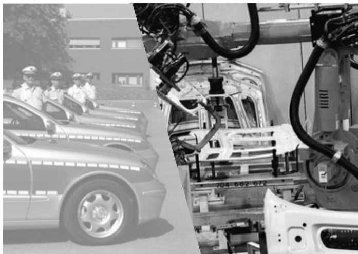
Menschenverachtung beim DaimlerChrysler-Lieferanten ARNECOM in Nicaragua