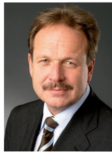
Frank Bsirske, Vorsitzender der Gewerkschaft ver.di

„Wir fordern, dass Bund, Länder und Gemeinden ökologische und soziale Ziele auch über ihre Beschaffungspolitik fördern – mit entsprechenden Vorgaben für die Vergabe von öffentlichen Aufträgen.“