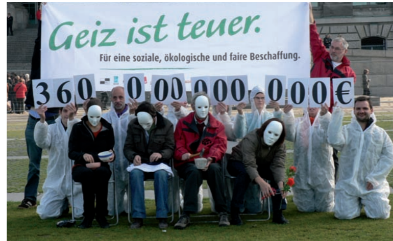
Bild unten: AktivistInnen des CorA-Netzwerks protestieren vorm Bundestag für Arbeitsrechte und Umweltstandards per Gesetz.

„Wir fordern, dass Bund, Länder und Gemeinden ökologische und soziale Ziele auch über ihre Beschaffungspolitik fördern – mit entsprechenden Vorgaben für die Vergabe von öffentlichen Aufträgen.“