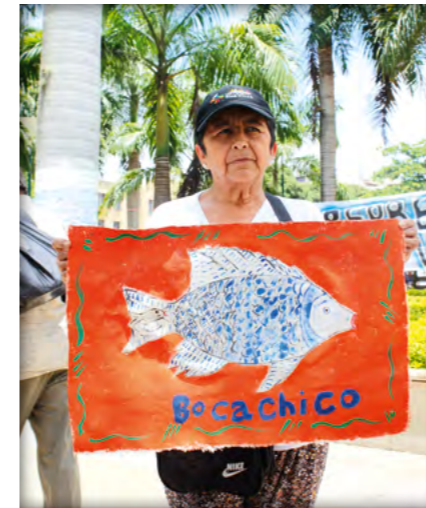
Proteste gegen den Hidrosogamoso-Staudamm

Die Bundesregierung hat das Projekt vor Vergabe der Hermesbürgschaft geprüft und kam dabei zu dem Schluss, dass Weltbankstandards entweder eingehalten oder im Laufe des Projekts erfüllt werden. Vor Ort zeigt sich jedoch ein anderes Bild: Die unzulänglichen Konsultationen, mangelhaften Entschädigungen und Gesundheitsbeeinträchtigungen verletzen sowohl Weltbankstandards als auch den Internationalen Pakt über die wirtschaftlichen, sozialen und kulturellen Rechte.