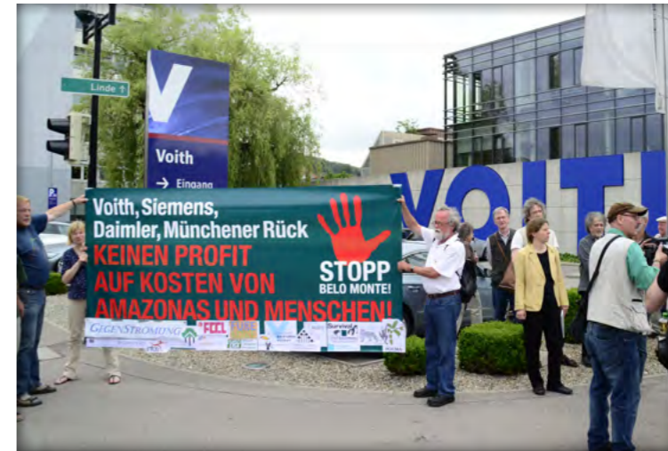
Demonstration in Heidenheim, 20.6.2012