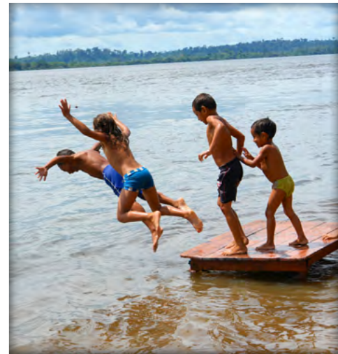
Kinder am Xingu-Fluss