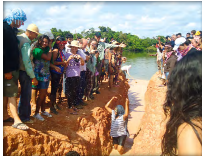
Aktivist/innen unterbrechen die Dammbauarbeiten

Obwohl die massiven Proteste gegen den Staudamm seit vielen Jahren bekannt sind, beteiligen sich mehrere Unternehmen aus Deutschland und anderen europäischen Ländern an dem Projekt: Voith Hydro (ein Joint Venture von Siemens und Voith) liefert Turbinen, Daimler liefert LKWs, Allianz und Munich Re (rück)versichern die Bauarbeiten 2 .