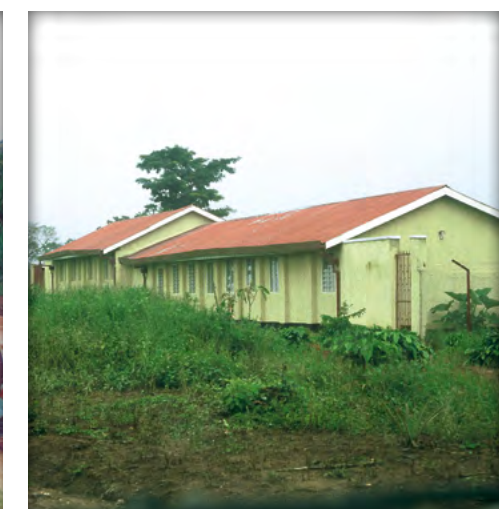
Ehemalige Schule, jetzt Geschäftsstelle