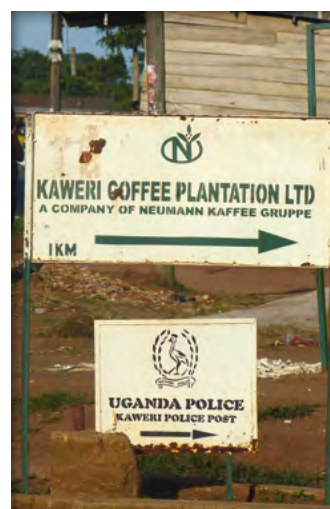
Kawerischild und Polizei

Die Leitprinzipien sind kein verbindliches Völkerrecht, beruhen jedoch auf bestehenden Menschenrechtsverpflichtungen und sind als Mindestanforderungen an Staat und Unternehmen im Bereich Wirtschaft und Menschenrechte zu verstehen.