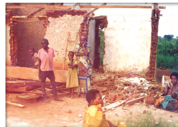
Zerstörtes Haus unmittelbar nach der Vertreibung